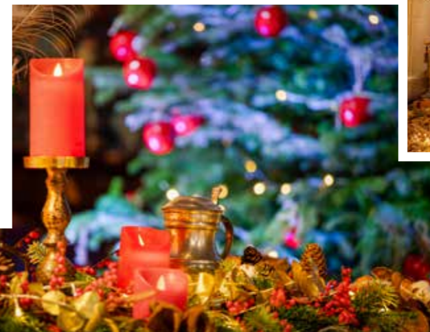
Table des festins avec ses faisans et paon ornés de leurs plumes, parures luxueuses prêtes à être revêtues, poulaines scintillantes au pied de la cheminée : le château de Langeais a imaginé des mises en scène nimbées par les bougies et les grands lustres décorés . Bougies et éclairages tour à tour intimistes, vifs, audacieux ou tamisés : de salle en salle, les somptueux décors sont renouvelés, tels des tableaux imaginaires brillant de mille feux.